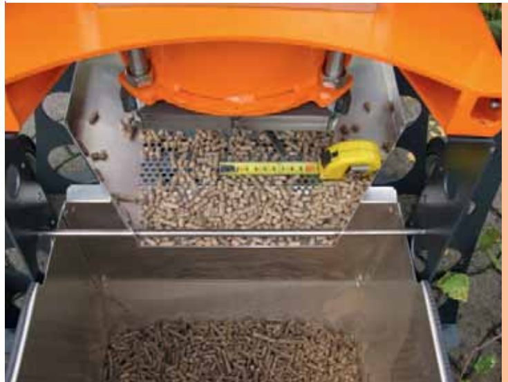
Beispiel geförderter Maßnahmen: Ecoworxx Pelletmaker für die Eigenherstellung von Dünger-, Einstreu- oder Futter-Pellets aus unterschiedlichsten Biomassen – Markteinführung mit Innovationsförderung des BMELV über die LR.

förderfähig. Ebenso kann die Schaffung eines ersten, nicht zur kommerziellen Nutzung geeigneten Prototyps sowie erster Demonstrations- und Pilotprojekte gefördert werden. Studien können bei Unternehmen (KMU) bis zu 50% und bei Forschungseinrichtungen mit öffentlich-rechtlichem Auftrag bis zu 100% gefördert werden. Sachkosten, z. B. zur Erstellung eines Prototyps, können bei mittleren Unternehmen bis zu 35%, bei kleinen Unternehmen bis zu 45% und bei Forschungseinrichtungen mit öffentlich-rechtlichem Auftrag bis zu 100% der zuwendungsfähigen Ausgaben bzw. Kosten gefördert werden. Die Förderung ist formlos bei der BLE – Projektgruppe Innovationsförderung – oder beim BMELV zu beantragen.